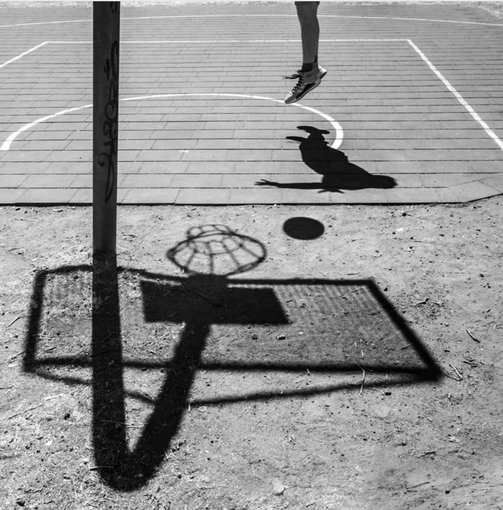
1. Platz Amateurrkategorie Sport: Wolfgang Wiesen (Deutschland): »Shadow Play«