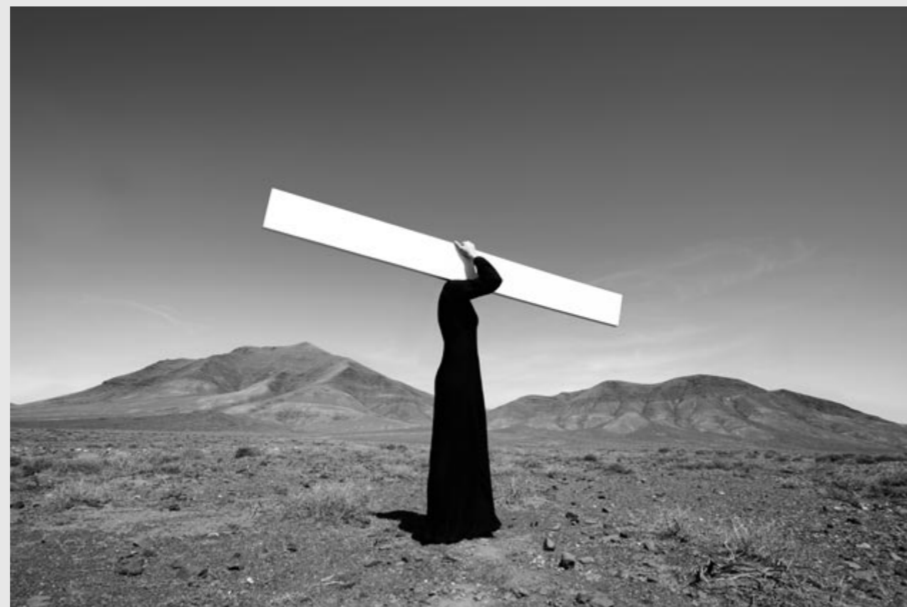
Unten: 1. Platz Profikategorie Fine Art: Astrid Verhoef (Niederlande): »Board«